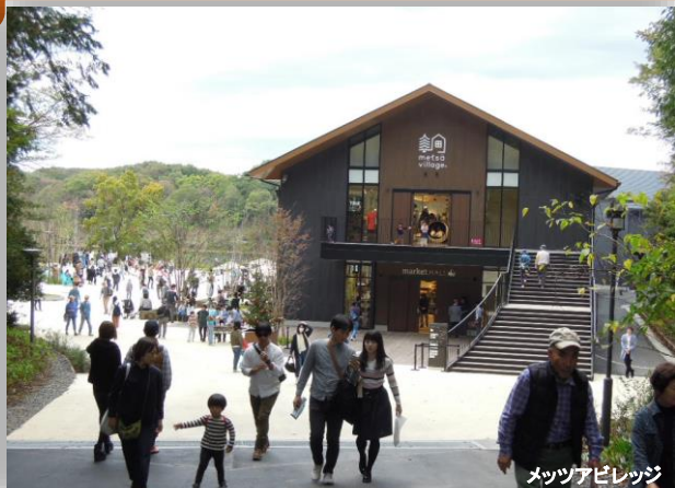
メツツアビレッジ